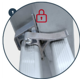
1 Sistema de bloqueo de seguridad. Security locking system. Système de verrouillage de sécurité. Sistema de bloqueio de segurança.