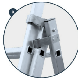
3 Guías de deslizamiento en aluminio. Aluminium slipping guides. Guides coulissants en aluminium. Guias de deslizamento em alumínio.