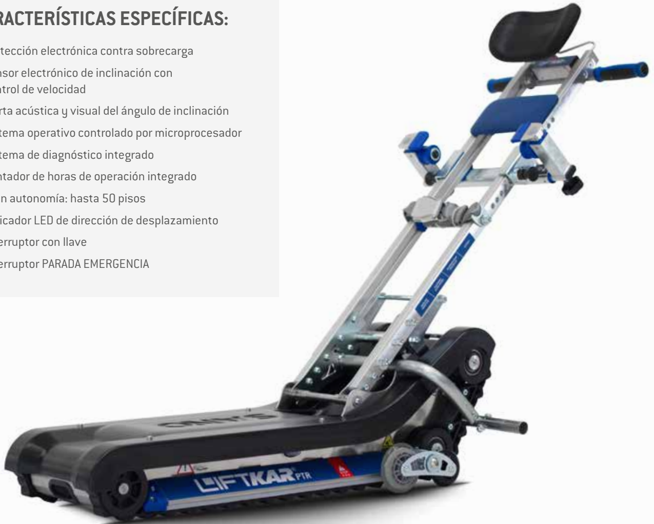
Foto de máquina incluyendo accesorios extras y soporte de silla plegable.

La oruga sube-escaleras Liftkar PTR es un aparato desarrollado especialmente para la movilización sobre escaleras rectas. Proporciona más libertad de movimientos a las personas con movilidad reducida a la vez que reduce el impacto sobre la espalda de la persona encargada de operar la oruga.