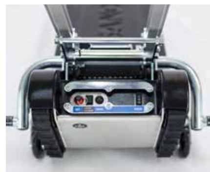
Elemento de control - Unidad básica