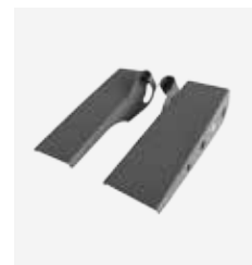
Patines PTR Art. Nº 975 103