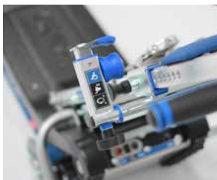
Abrazadera regulable para la silla de ruedas