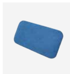
Respaldo PTR Art. Nº 975 104