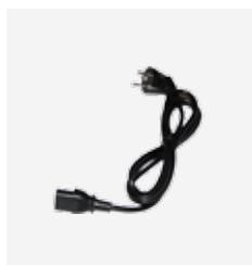
Cordon d'alimentation PTR Art. Nº 075 664