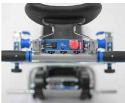
Elemento de control - Manillar