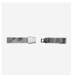
Cinturón de cadera PTR Art. Nº 075 105 [montado fijo]